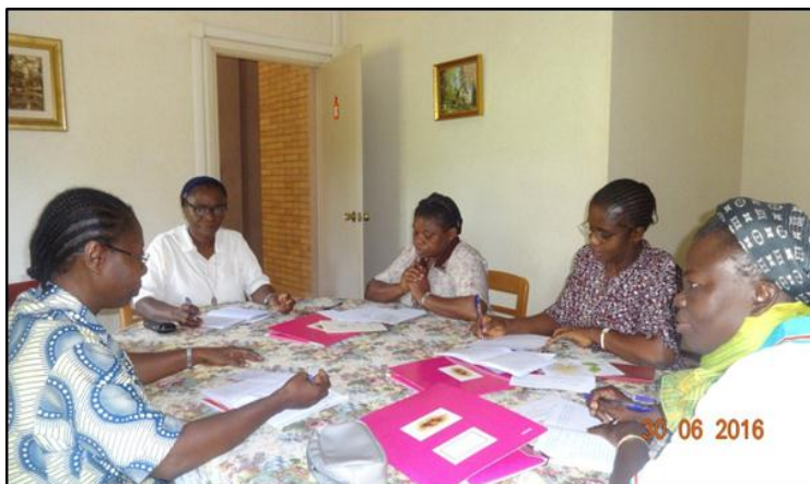
R. D. Congo

La tâche : prioriser les 2 domaines les plus importants qui nécessitent une attention dans le contexte particulier